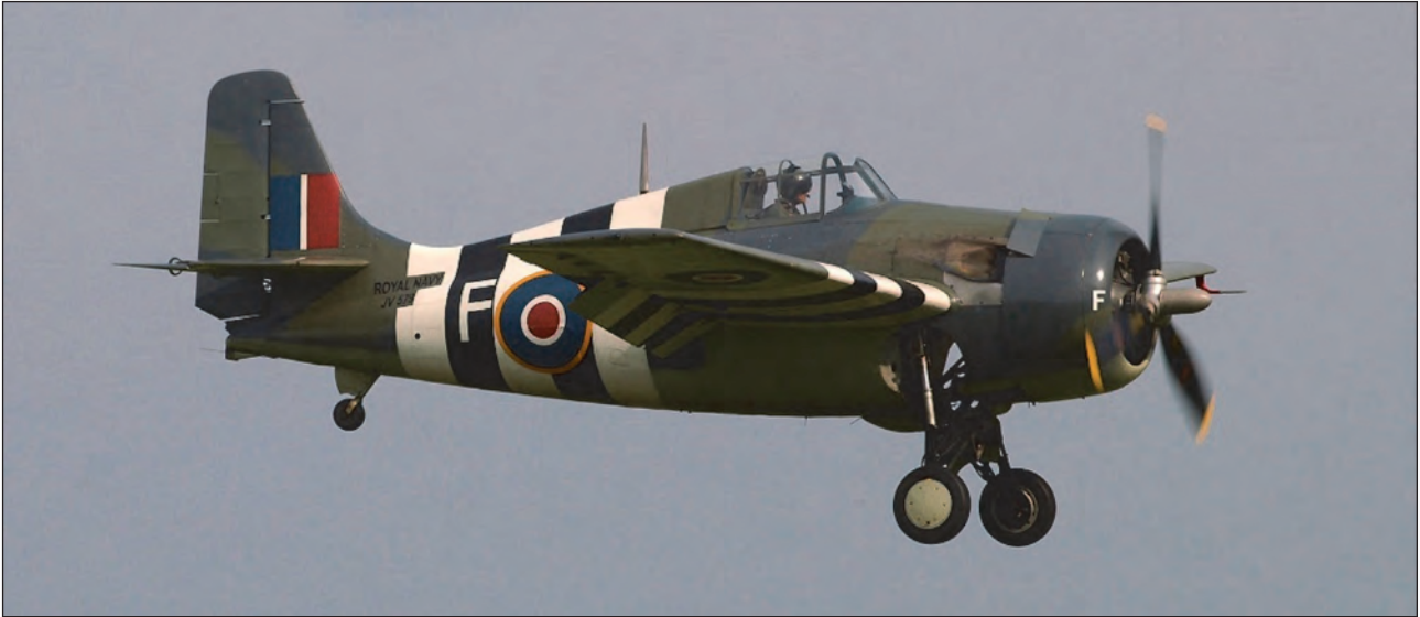
14. ábra. A Grumman F4F Wildcat az első nagyobb számban gyártott amerikai hordozó-vadász volt. (A képen RAF színekben.) A Wildcat nem bizonyult igazán jó vadásznak

mérföldnyire maga Yamamoto vár hét csatahajójával és egy hordozóval (a HOSHO-val) az amerikai flotta felbuklására. Délről Takasu altengernagy nehézcirkálói fedezik a támadókat.