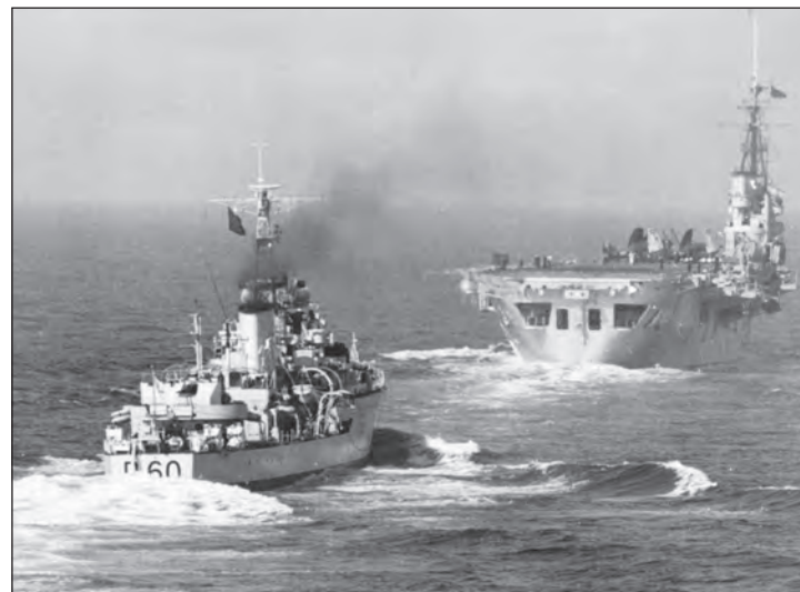
13. ábra. A COLOSSUS-osztályú HMS VENGEANCE (R71-es) könnyű hordozó a HMS SULYS (D60-as) romboló társaságában. A HMS VENGEANCE a háború után az Ausztrál Haditengerészet kötelékében teljesített szolgálatot

A válasza egy hónapot sem kellett várni. A japánok híres admirálisa, Yamamoto úgy döntött, hogy a kulcsfontosságú Midway-zátony elleni támadásával kicsalogatja az amerikai hordozókat és végső csapást mér rájuk. A terv pofonegyszerű volt: az N-3. napon Hosogawa tengernagy megtámadja az Aleut-szigeteket. Az N-2. napon Nagumo hat hordozójának repülői elkezdik bombázni a szigetet. Az N napon Kondo tengernagy nehézcirkálóinak támogatásával megérkezik a Tanaka altengernagy által vezetett mintegy 4500 fős partraszálló erő. Mindeközben a szigetektől 300