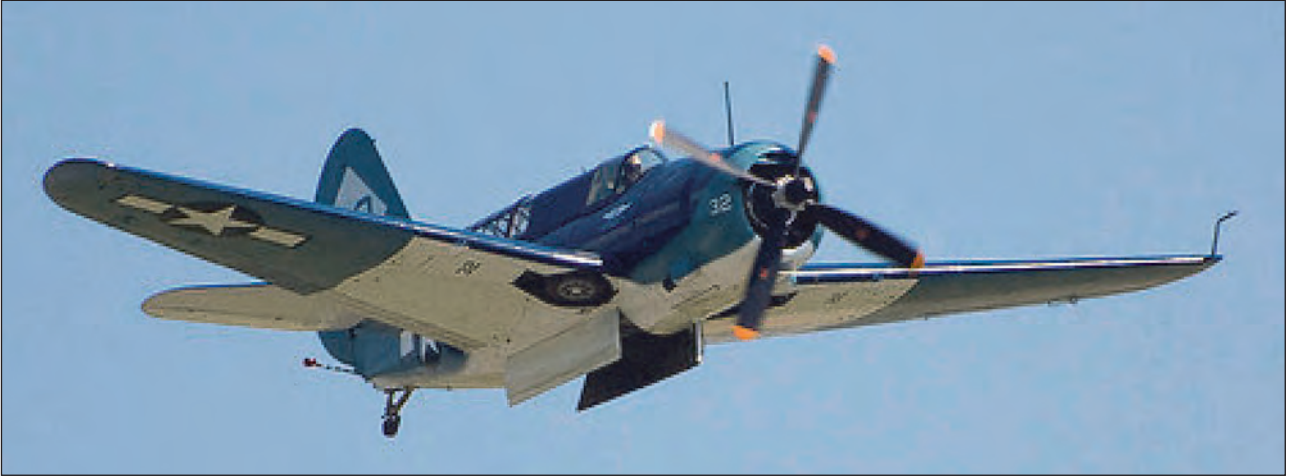
16. ábra. Az 1943-tól alkalmazott Curtiss SB2C Helldiver 450 kg bombát vagy torpedót hordozott belső bombakamrájában, és két gépágyúja, illetve egy géppuskája is komoly veszélyt jelentett minden ellenséges földi vagy akár légi célra is

ellentámadása után a YORKTOWN sorsát végül is az I-168-as japán tengeralattjáró torpedói pecsételték meg, és a hajó június 7-én elsüllyedt. A reménytelen helyzetbe jutott lángoló AKAGI-t június 6-án a legénysége süllyesztette el, és hamarosan követte a HIRYU is, melyet az utolsó felvonásban megtaláltak a HORNET és az ENTERPRISE repülői. A hordozók pusztulása után visszavonuló japán flottából még aznap délután elsüllyesztették a sérülés következtében lelassult MIKUMA nehézcirkálót is, így téve teljessé a győzelmet.