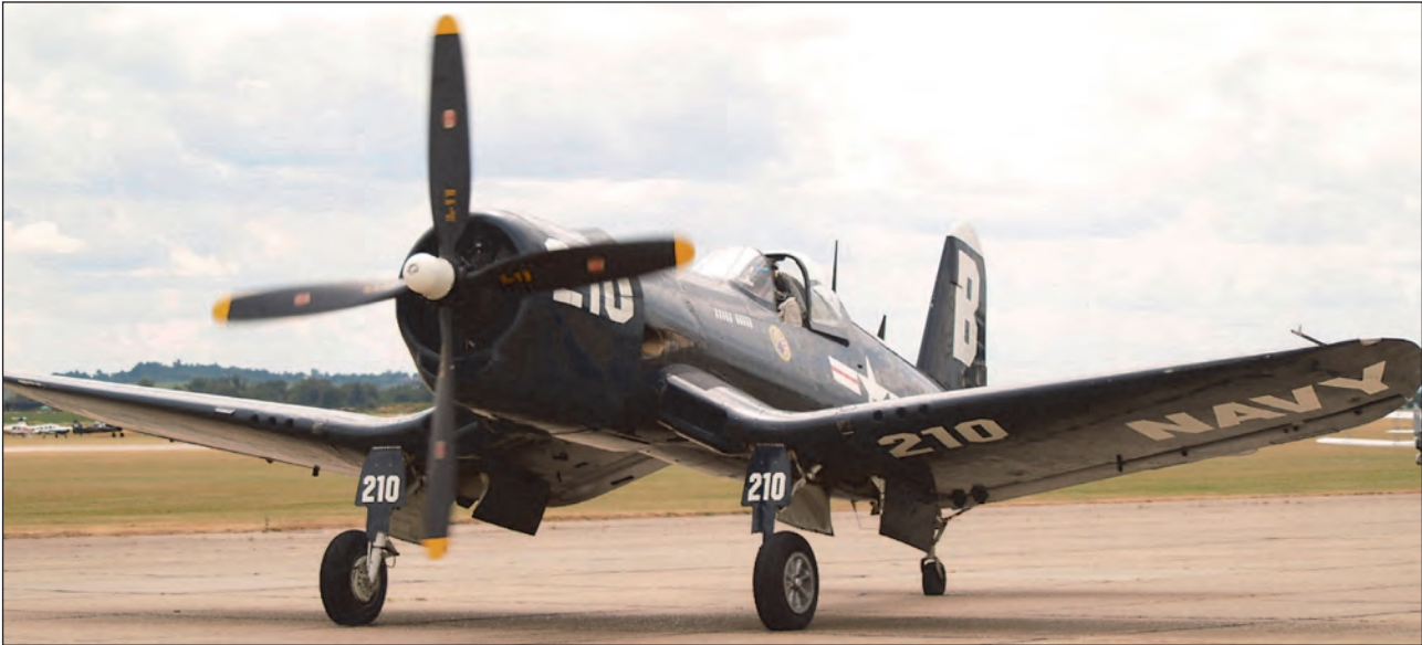
18. ábra. A Chance Vought F4U Corsair megjelenésekor, 1943-ban a legnagyobb teljesítményű, gyors és fordulékony gép volt. Nyolc géppuskával volt felfegyverzve, emellett 454 kg bombát is szállíthatott