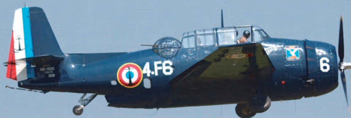
12. ábra. A Grumman TBF Avenger a háború vége felé került a harcoló alakulatokhoz. A támadó feladatokra alkalmas gépnek öt géppuskája volt és 900 kg torpedót vagy bombát tudott célba juttatni