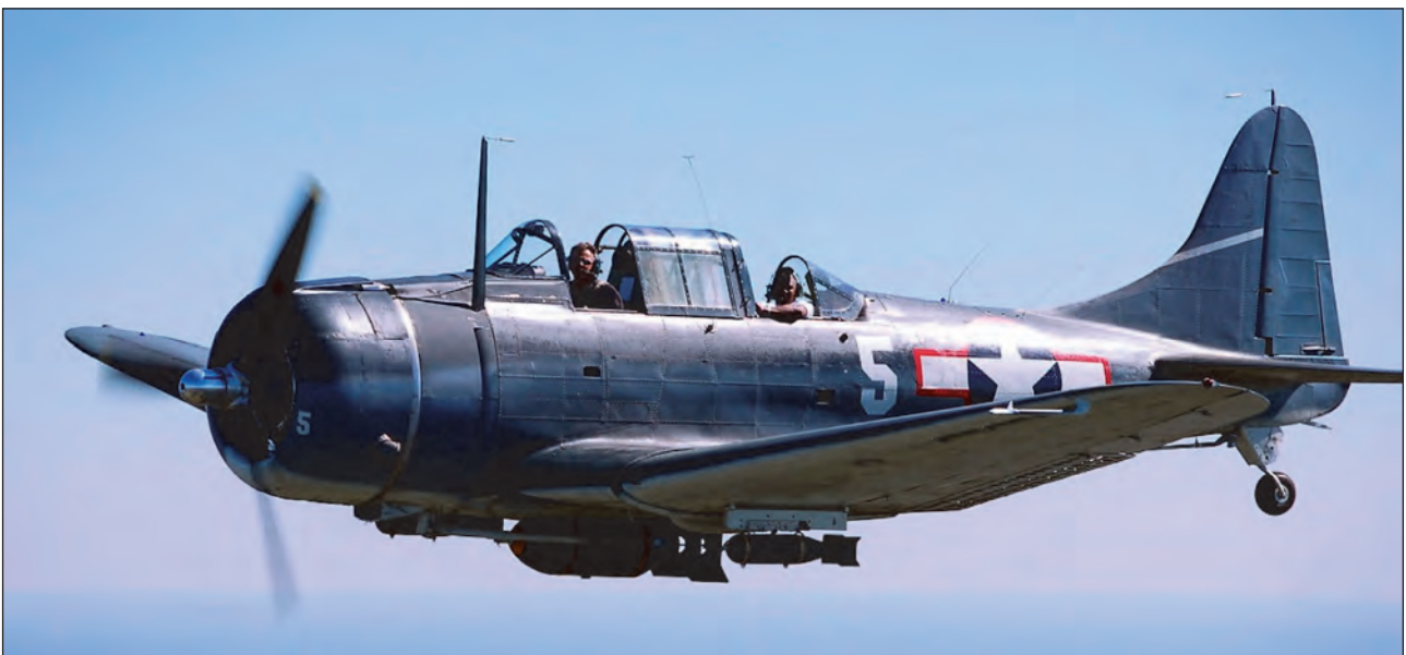
15. ábra. Az amerikai Douglas SBD Dauntless zuhanóbombázó védelmi fegyverzete géppuskákból állt. A repülőgépből 1944 júliusáig megbízhatósága miatt közel 6000 darabot gyártottak

A SORYU, az AKAGI és a KAGA pillanatok alatt több találatot kapott és a SORYU, illetve a KAGA még aznap elsüllyedt a fedélzetet elborító tűzben. A sértetlen HIRYU